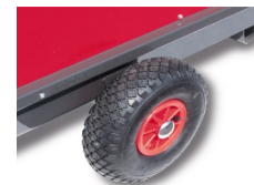
Roues gonflables de série sur TA 22 P En option pour autres modèles