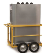
Kit pompe électrique