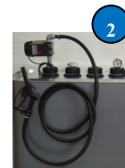
Kit pompe élec-