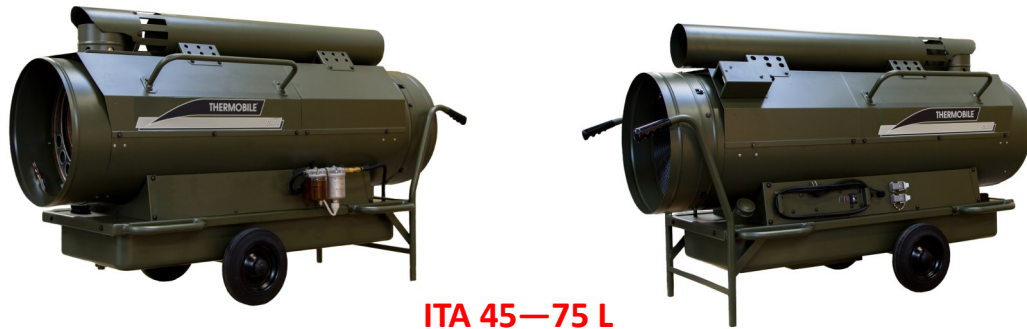
ITA 45—75 L

L'ITA-L est un appareil de chauffage d'abris, robuste et compact, destiné aux organisations civiles et militaires qui opèrent dans des zones et conditions difficiles. Il est utilisé par les militaires lors de missions humanitaires et de sauvetage, pour chauffer les tentes et les hôpitaux de campagne. L'ITA-L est livré complet, avec thermostat, cheminée et possibilité de gaines de soufflage et de recirculation.