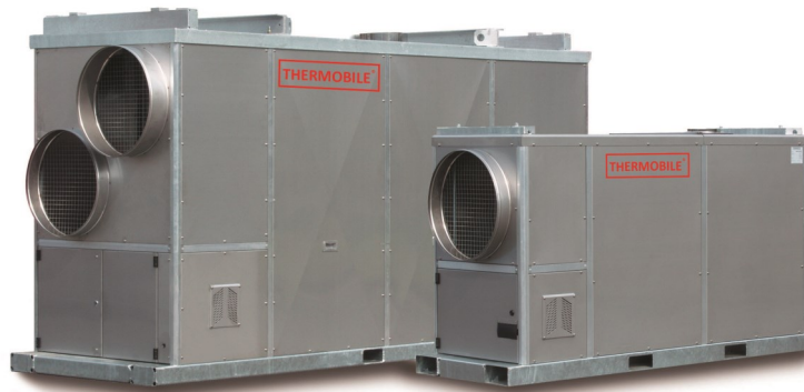
IMAC 2000 S *