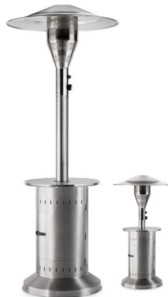
CALIPSO INOX PRO*