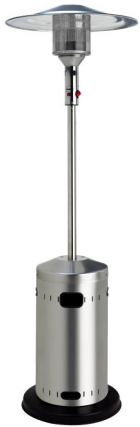
CALIPSO INOX CLASSIQUE (existe en version rétractable)