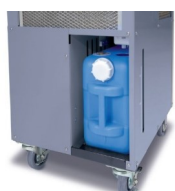
Bac de récupération des condensats