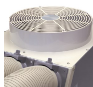
Sortie d'air chaud