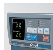
Minuteur et thermostat d'ambiance digital