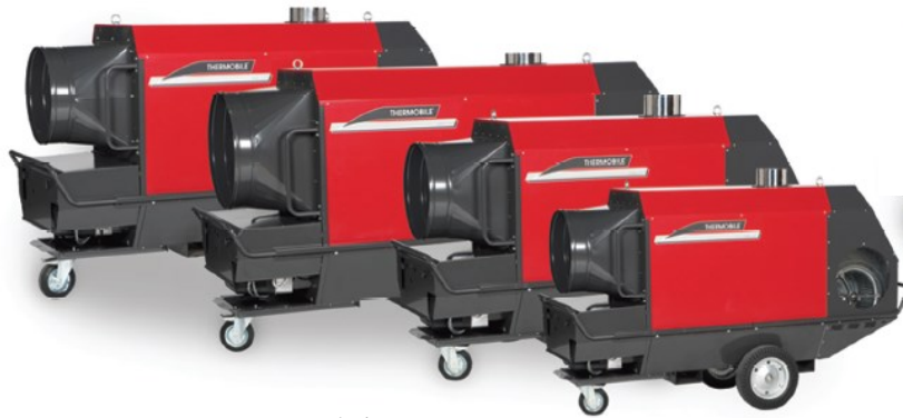
IMA-200 Radial IMA-150 Radial IMA-111 Radial IMA-61Radial