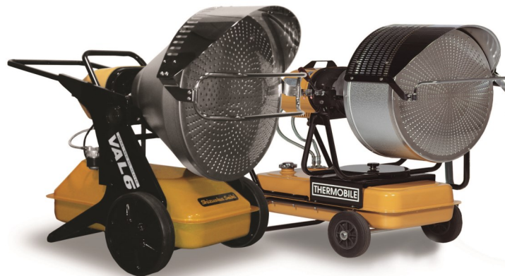
VAL 6 EPX