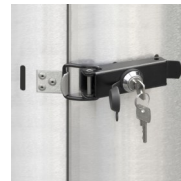
Porte avec cadenas